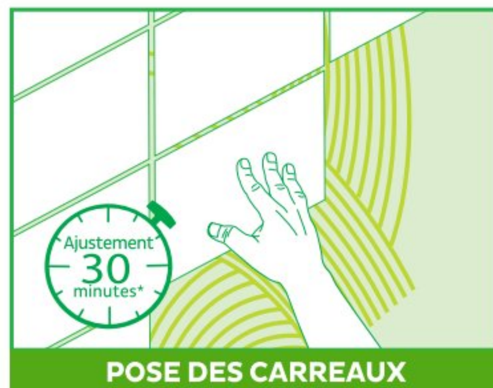
POSE DES CARREAUX

Une fois la colle appliquée sur le support, il reste 20 min environ*