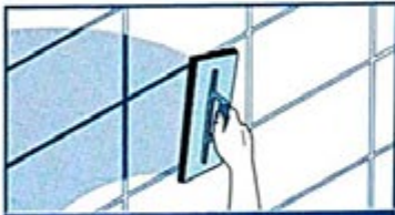
APPLICATION DU JOINT

Déposer puis étaler le joint dans le sens de la diagonale des carreaux avec une raclette. Veiller au bon remplissage des joints et enlever l'excédent de produit. Après 5 min* sur faïence et 15 min* sur grès céramique, poser un doigt sur le joint, retirer celui-ci et vérifier que le produit ne colle pas au doigt. Si le produit reste collé au doigt, répéter l'opération toutes les 5 min.