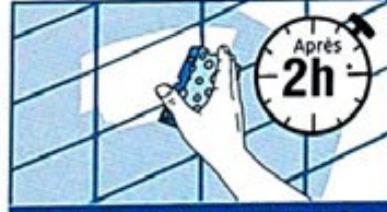
LISSAGE DES JOINTS / NETTOYAGE

Déposer puis étaler le joint dans le sens de la diagonale des carreaux avec une raclette. Veiller au bon remplissage des joints et enlever l'excédent de produit. Après 5 min* sur faïence et 15 min* sur grès céramique, poser un doigt sur le joint, retirer celui-ci et vérifier que le produit ne colle pas au doigt. Si le produit reste collé au doigt, répéter l'opération toutes les 5 min.