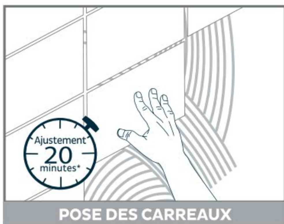
POSE DES CARREAUX

Une fois la colle appliquée sur le support, il reste 20 min environ* pour poser le carreau